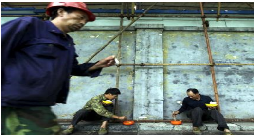
Obreros de construcción en Pekín

En 1981, la filósofa Angela Davis pidió que se buscara la manera de “socializar el cuidado de los hijos, socializar la preparación de comida e industrializar el trabajo doméstico, convirtiendo todos esos servicios en algo realmente accesible para la clase obrera”. Según parece, ha ocurrido justo lo contrario: el coste de todas esas actividades, cada vez más, lo asume en solitario cada individuo o cada familia (y entonces suele recaer sobre las mujeres). En su ensayo ¡Reconquista tu tiempo! , la escritora y periodista Jenny Odell reconoce que, agobiada por la disponibilidad y la atención exigidas por su trabajo, llegó a considerar que tareas como ordenar calcetines o cocinar formaban parte de sus momentos de ocio más emocionantes.