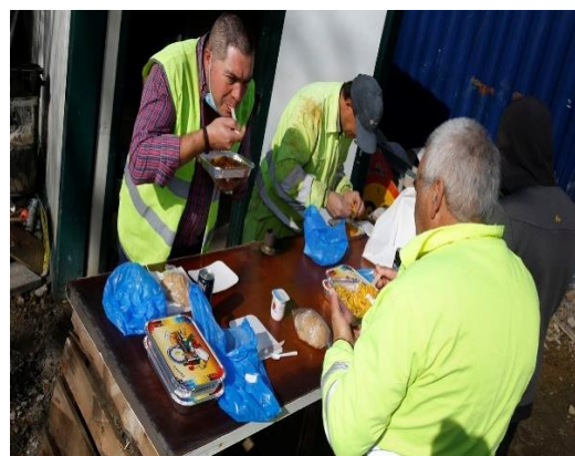
La Voz de Galicia

Muchos empleadores (y muchos profesionales que se autoexplotan) fantasean con la posibilidad de no tener que interrumpir su producción o su trabajo con pausas para hacerlo, y esa incomodidad respecto a algo tan necesario se traduce en todo tipo de estrategias para aligerarlo y optimizarlo. El táper fue una de las primeras: ideado para conservar frescos los restos de comida (gracias a su tapa hermética) y mantener ordenadas las cocinas, su uso como tartera para transportar alimentos entre casa y trabajo ha sido el que lo ha convertido en uno de los objetos de uso cotidiano más odiados, casi un símbolo que representa todo lo que está mal en nuestras vidas laborales.