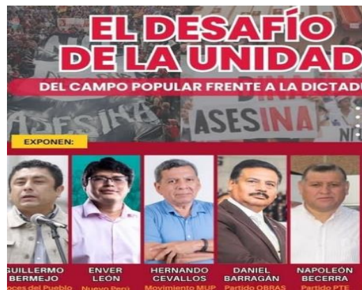
Facebook del MUP

Resultado de su faena congresal a Perú Libre, entre otras razones, le ha traído como consecuencia que la bancada de 37 integrantes hoy sea reducida a 12 miembros; en tanto la organización política ante los ojos del pueblo, esta completamente desacreditada, desprestigio que le va a resultar sumamente difícil superar la barrera en las próximas elecciones generales, con el riesgo de perder la inscripción ante el JNE.