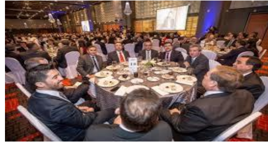
Portal Minero. Burguesía cenando y no en táper.

el transporte o la atención al público en periodos de gran afluencia) y ahora están presentes en las vidas de todos los trabajadores.