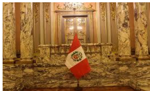
Palacio de gobierno