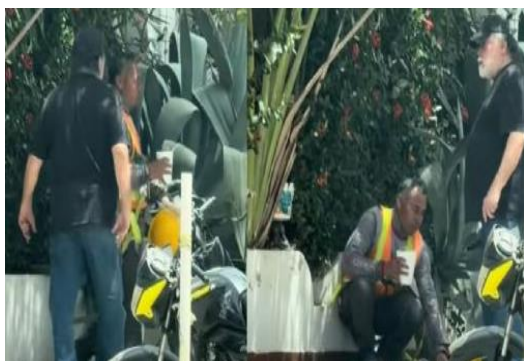
SD El Siglo de Durrango

En la cinta, el “soylent green” es el único alimento que consume la población empobrecida de la ciudad y, aunque la empresa que produce estas galletas anuncia que están hechas con plancton, el protagonista, un policía interpretado por Charlton Heston, descubre que contienen restos humanos. Sin miedo a que su producto fuera asociado con la película, en 2013, Rob Rhinehart, ingeniero en Silicon Valley, comercializó los polvos Soylent, un superalimento que se ingiere en forma de batido y que, según su creador, proporciona todos los nutrientes que el cuerpo necesita, eliminando la necesidad de cocinar o sentarse a la mesa.