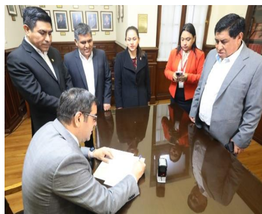
Congreso de la República

tentar la reelección parlamentaria o ser candidato y por supuesto ganar cualquier otro cargo de elección, como presidente regional, alcalde, etc.