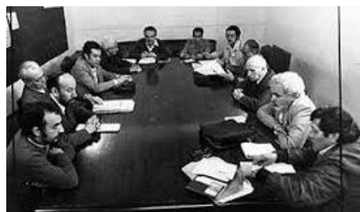
Fundación de Izquierda Unida

Decían que, la táctica de participación electoral manejada en esa coyuntura nacional de lucha popular, tenía como única finalidad utilizar las elecciones generales y de llegar al parlamento nacional, como tribuna para la agitación, propaganda y educación revolucionaria, bajo el esquema de acumulación de fuerzas, para salir del somero reflujo en el que había caído el movimiento obrero y popular.