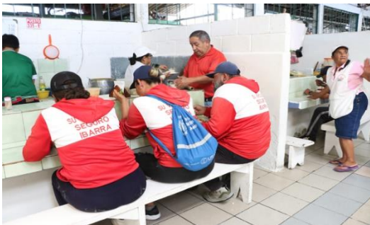
Diario El Norte

Eso nos habla de una aceleración más cercana a los tiempos actuales que al régimen temporal de los años veinte o treinta, mucho más pausado o de larga duración. El táper, para mí, es una especie de bisagra: está en la transición entre ese estilo tradicional, de conservar y el estilo acelerado de cosas de un solo uso, donde nada dura y continuamente consumimos, reponemos y tiramos objetos”, continúa.