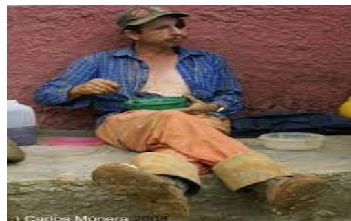
Todos Somos Iguales

Así que no todo es negativo respecto a estos objetos. De hecho, Ruibal recuerda que el táper forma parte de unas dinámicas de